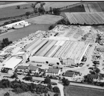
Fábrica Mall GmbH en Donaueschingen (Alemania)